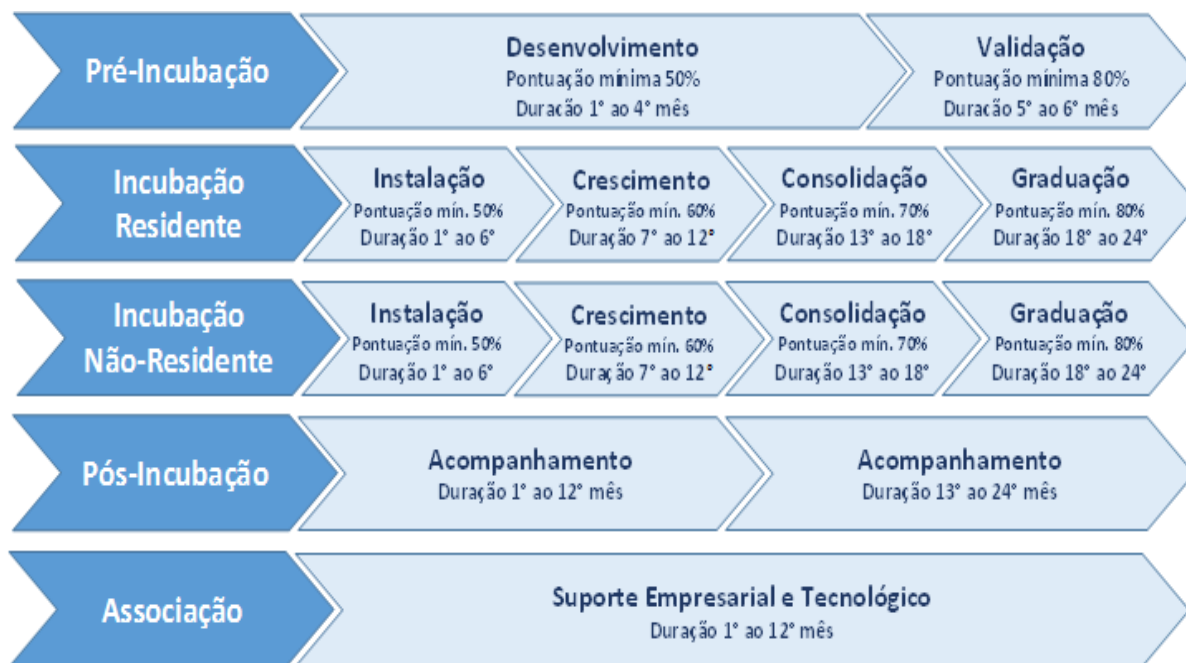
Figura 2 – Fases do Processo de Incubação

As Fases são extremamente importantes e diferenciam a maturidade do empreendimento, sendo necessário que o empreendimento obtenha pontuação mínima estabelecida por meio de diagnóstico/monitoramento semestral, para que possa prosseguir para as próximas fases.